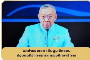
พลตำรวจเอก เพิ่มพูน ชิดชอบ รัฐมนตรีว่าการกระทรวงศึกษาธิการ