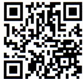
(นางหัทธกาญจน์ อุดลธิรเชตต์) ศึกษาธิการจังหวัดลำปาง

จึงเรียนมาเพื่อทราบ และถือปฏิบัติตามประกาศดังกล่าวโดยทั่วกัน