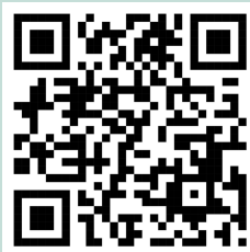
ตาสิบประรด