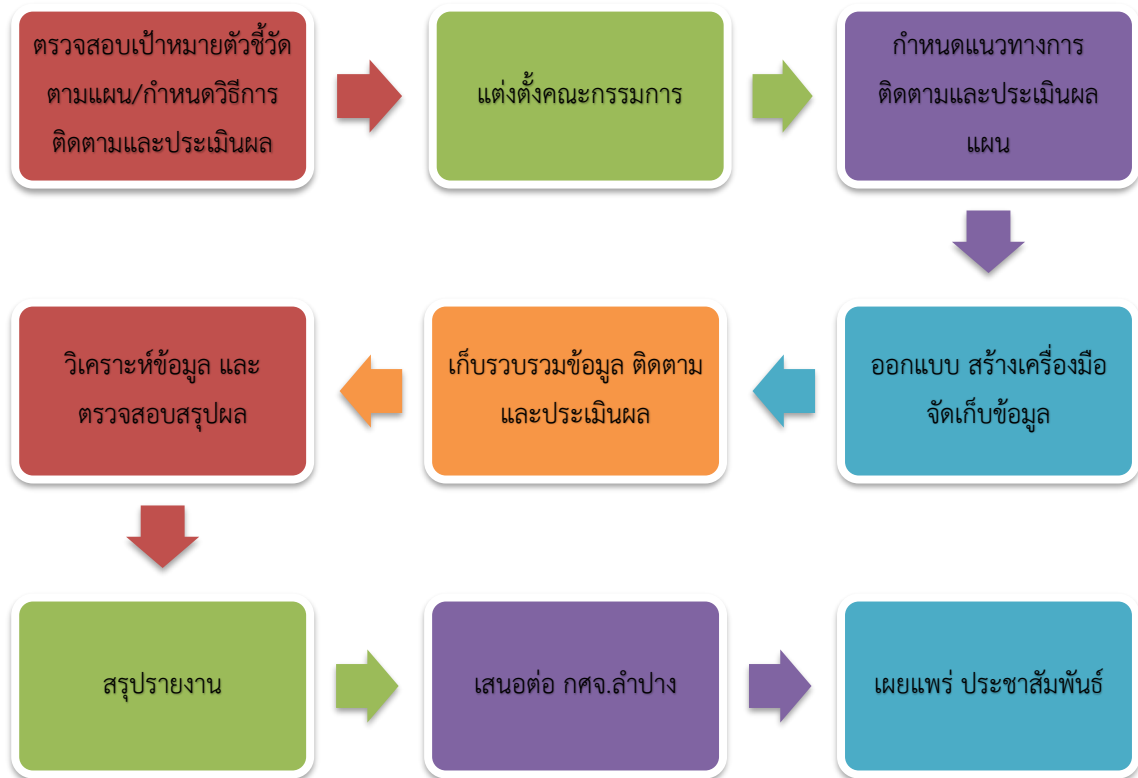
แผนภาพที่ 1 แสดงขั้นตอนการดำเนินงาน